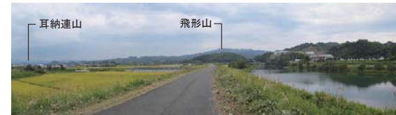
八女市犬馬場附近