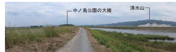
筑後市津島西附近・筑後広域公園