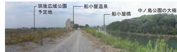
筑後市津島附近・筑後広域公園・船小屋南