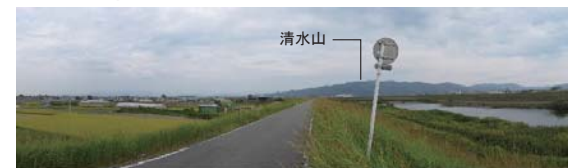
みやま市瀬高町中土居附近